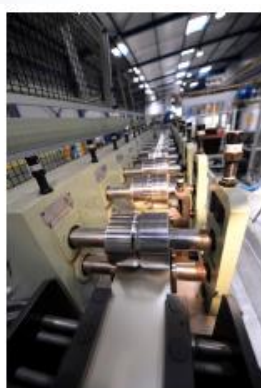
Entrée des galets