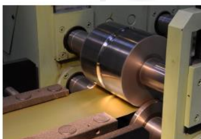
Engagement du feuilard

Notre fournisseur PSO utilise des feuillets aluminium fabriqués par METALCOLOR (Suisse)