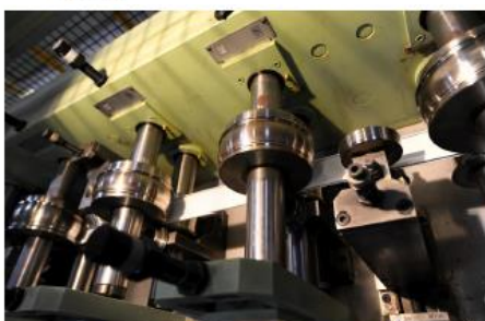
Fermeture du profil