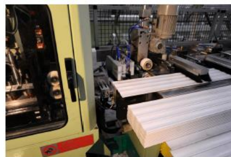
Poinçonnage et enfilage final

GAMME : 39, 42, 56 mm avec densité de mousse pu de 94kg/M3